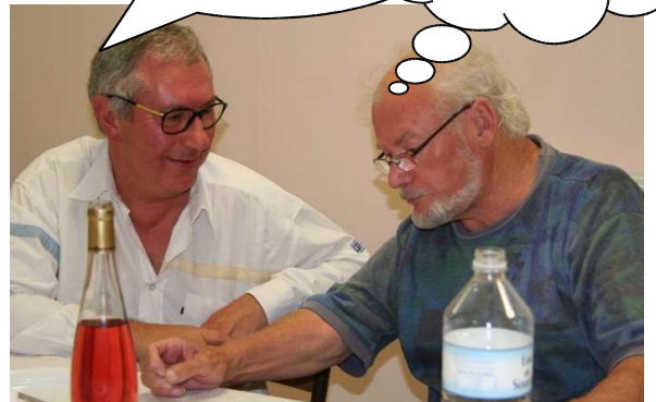
n : ça va encore nous coûter